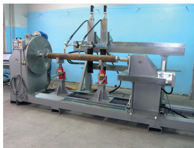
Рис. 5. Установка АС354 для наплавки тел вращения