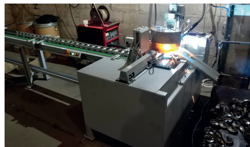
Рис. 6. Конвейер АС415 для МИГ- сварки горловины с доннышком корпуса огнетушителя