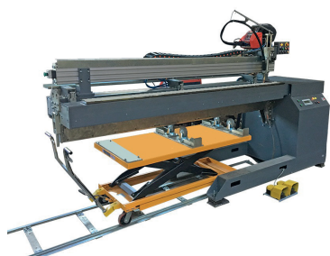
Рис. 4. Установка АС308-2500 для МИГ-сварки труб длиной до 2,5 м