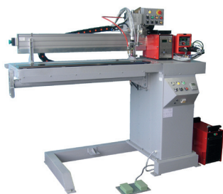
Рис. 7. Установка АС333 для ТИГ-сварки продольных швов труб

Наряду с такими простыми в отношении управления установками, фирма освоила производство более сложных автоматов, которые имеют от двух до четырех степеней подвижности с сервоприводами. Одна из них обеспечивает вращение или кантовку изделия, а остальные – транспортные перемещения горелки по одной (X), двум (X и Y) или трем (X, Y и Z) осям. В таких установках обеспечивается контурное управление перемещением горелки по линейной траектории с заданием требуемой линейной скорости горелки и окружной скорости вращения изделия, а также параметров колебаний горелки относительно линейной траектории. Освоение новых аппаратных