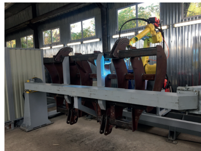
Рис. 3. Робототехнологический комплекс РК759 для МИГ-сварки крупногабаритных изделий