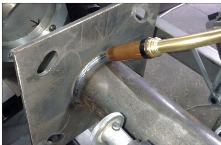
Рис. 2. Кольцевой шов соединения трубы с фланцем

также диагностику их состояния от контроллера;